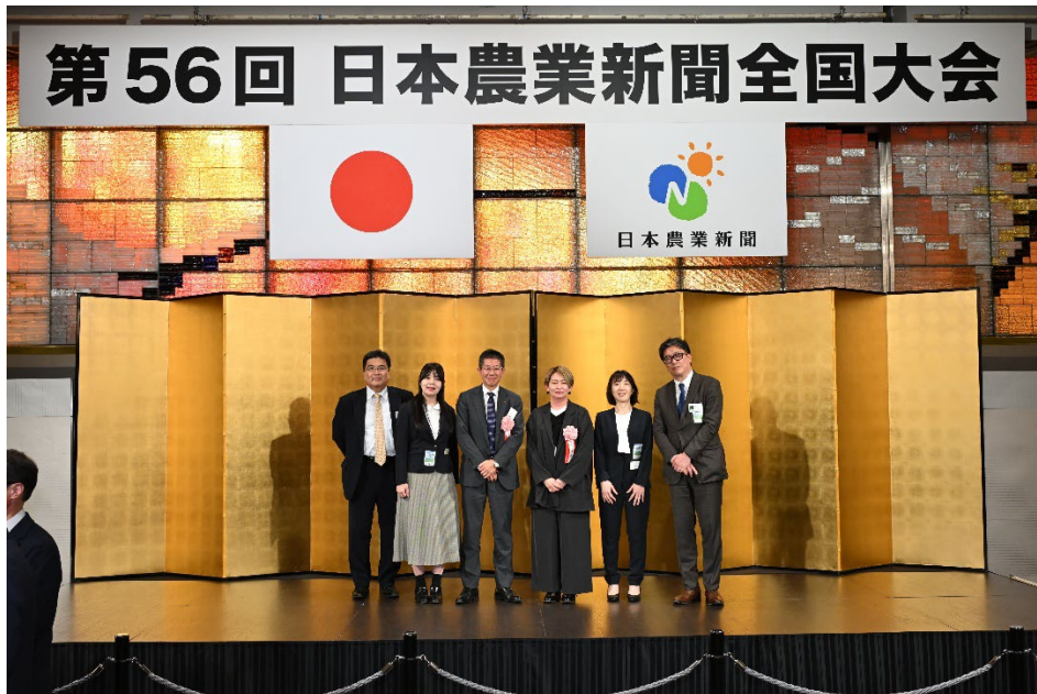
写真3. 表彰式の様子