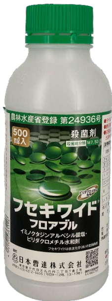
写真2. フセキワイド®フロアブル

フセキワイド®フロアブルは、2025年5月に上市された新しい農薬です。今回の受賞を励みに、本キービジュアルの持つインパクトを活かしてさらなる認知向上を図るとともに、より多くの農業現場で活用いただき、日本の農業生産に貢献してまいります。