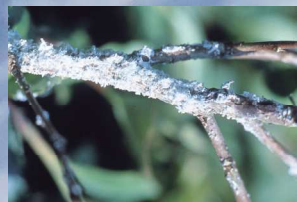
クワシロカイガラムシ