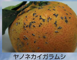
ヤノネカイガラムシ