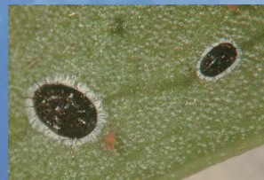
チャトゲコナジラミ