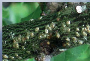
ウメシロカイガラムシ