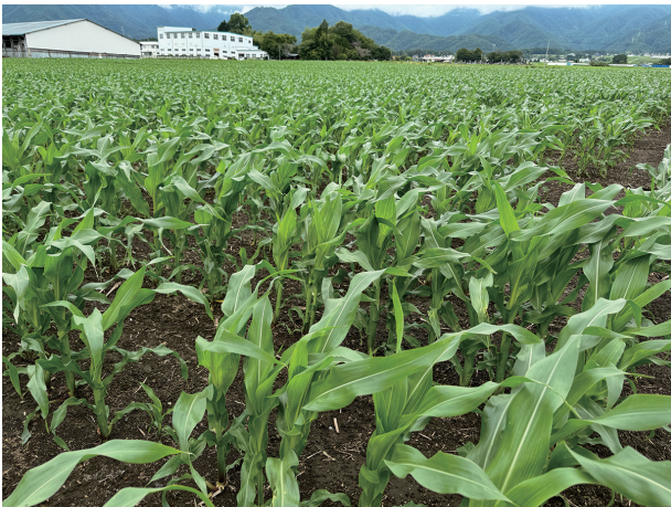
写真 6. トブラメゾン液剤によって雑草防除に成功している飼料用トウモロコシ畑 (2024年7月2日長野県南箕輪村)

特に比較的生育が進み最大 14 葉期にまで達するアレチウリにも高い効果が認められたことから、長期にわたってダラダラと発生する外来雑草の発生ピークを待ってから処理することも可能である。