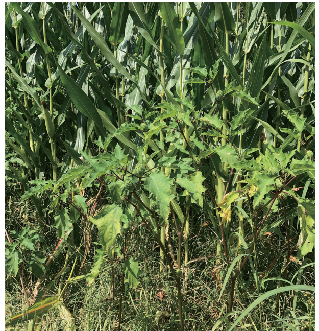
写真4. ヨウシュチョウセンアサガオ

の大きさに加え難防除性が高い外来雑草によるリスクは甚大なものとなる。これまでリスクの低減化を図るため、様々な除草剤や防除体系の開発が進められてきた。それによって問題が顕在化した当初と比べると、発生草種に応じた防除体系を選択できるようにはなってきた。しかしながら大規模化が進んだ生産者からは、発生草種に応じた防除体系を圃場ごとに取り入れることは困難であるという声が聞かれ、幅広い雑草種に効果の高い防除技術の開発が期待された。