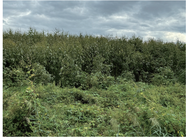
写真2. オオブタクサ