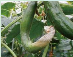
きゅうり/灰色かび病