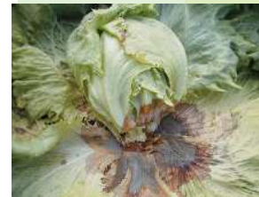
レタス/灰色かび病