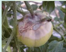
トマト/灰色かび病