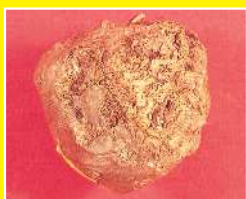
こんにゃく/乾腐病