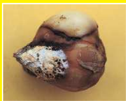
チューリップ/球根腐敗病