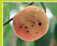
もも/せん孔細菌病