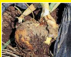
たまねぎ/灰色腐敗病