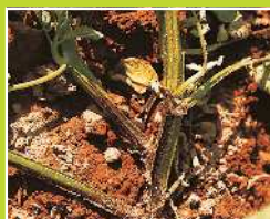
ばれいしょ/黒あし病