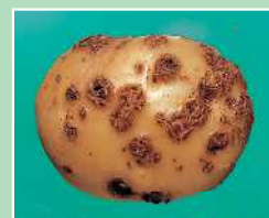
ばれいしょ/そうか病 (放線菌)