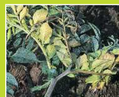
こんにゃく/腐敗病