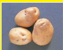
ばれいしょ/黒あざ病