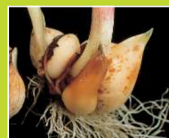
チューリップ/かいよう病