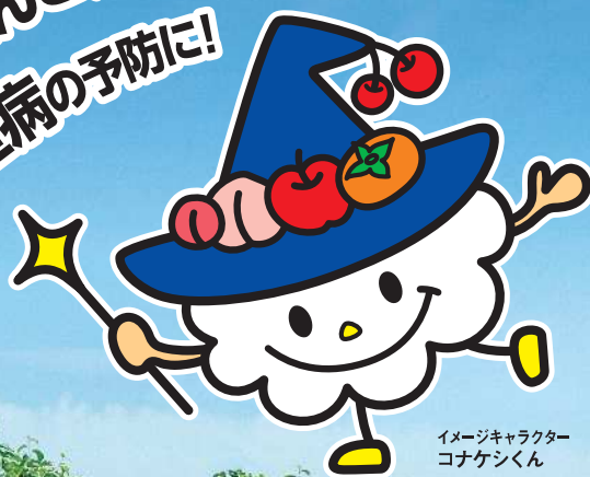
イメージキャラクター コナケシくん