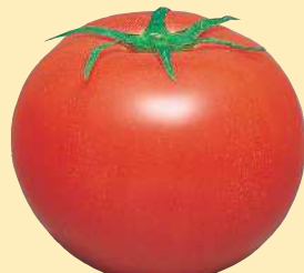
トマト・ミニトマト 灰色かび病、葉かび病に有効。