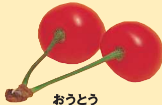
おうとう 灰星病に有効。