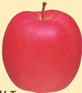
りんご 斑点落葉病、黒星病、褐斑病、 すす点病、すす枯病、輪紋病、 黒点病に有効。