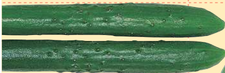
きゅうり 灰色かび病、うどんこ病、 菌核病に有効。