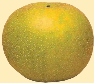
なし 黒斑病、黒星病、輪紋病、 うどんこ病に有効。