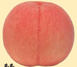
もも 灰星病、黒星病、 ホモプシス腐敗病に有効。