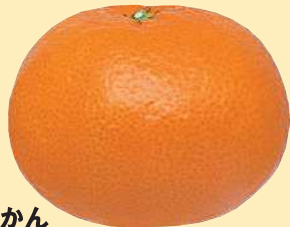
みかん 灰色かび病、貯蔵病害(青かび病、 緑かび病、黒腐病、軸腐病)に有効。 かんきつ 幹腐病に有効。