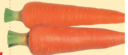
にんじん 黒葉枯病、うどんこ病、 斑点病に有効。