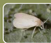
オンシツコナジラミ