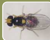
トマトハモグリバエ