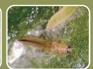
ミナミキイロアザミウマ