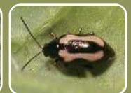
キスジノミハムシ