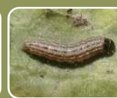
ハイマダラノメイガ