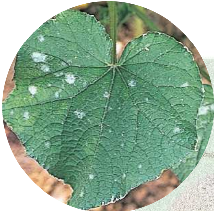
ハーモメイトの散布適期