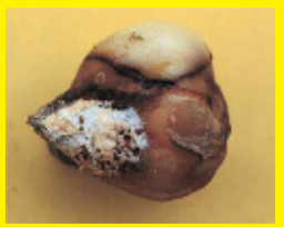
チューリップ/球根腐敗病