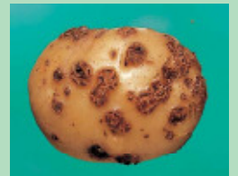
ばれいしょ/そうか病 (放線菌)