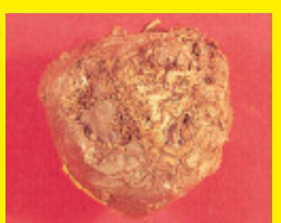
こんにゃく/乾腐病