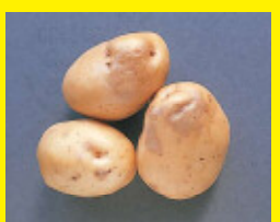
ばれいしょ/黒あざ病