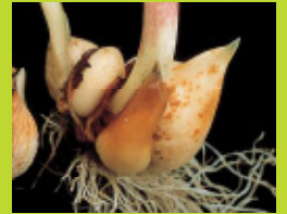
チューリップ/かいよう病